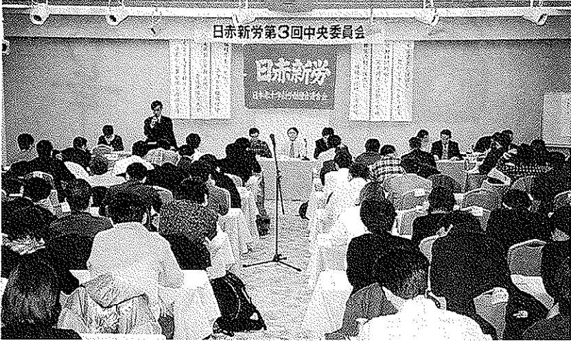
日赤新労第3回中央委員会