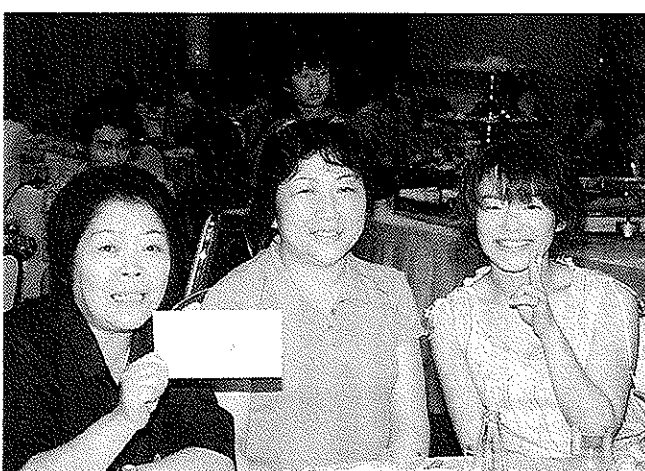
豪華商品ゲットに思わずVサイン

「当時の抗夫たちの作業ぶりなどが電動人形やミニチュアなどで再現されており、訪れる人々を歓迎し、にっこり微笑んでくれるところ。金山は歴史も古く、展示資料館などもあり、一見の価値ありです。」