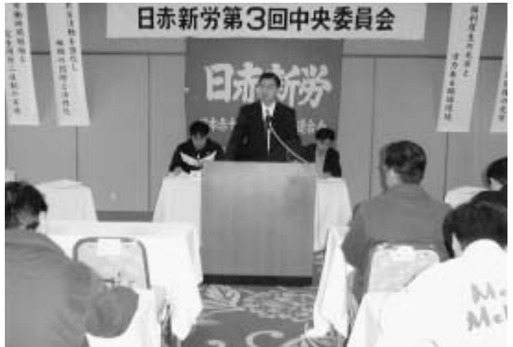
日赤新労第3回中央委員会

昨年、日赤新労が独自に強く要求してまいりました福利厚生について、幾度も本社と協議を重ね、確認書の締結に至り、全社的福利厚生事業としていよいよこの四月からスタートする