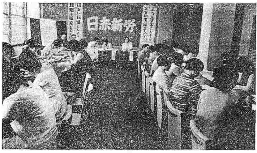
重大決意を秘め、会議に臨む婦人部員