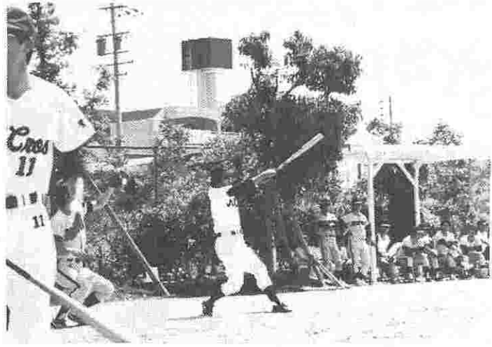
奮闘する豊橋血セの「ベアーズ」