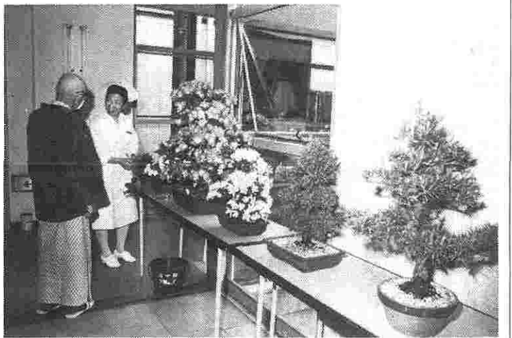
入院・外来の患者さんにも大好評でした

名古屋第一赤十字病院従業員組合の中に、園芸クラブがあります。その活動の一部として、五月二十八、九日の両日、院内にて第十三回さつき展が催されました。 クラブの歴史は昭和四十六年五月に、会員五十人、内役員九人で始まりました。当時、植物・園芸に興味のある一部の愛好者が、親睦・保健・情操・栽培技術等の向上にはどうかとの声が上がります。また色々な栽培の質問などもあり、大盛況の二日間でした。 この会の発足当時は、「さつき」の最盛期であったこともあり、手始めとして、さつきの三年生苗、三種類を配布し、栽培することにしました。それらの苗を翌年の五月、第一回のさつき展の競技花として出品して行ったのが始まりです。現在も初回配布品が手元に残り、成木として今回出品した人もいます。 昨年はいつもよりも多く、さつきの花も挿し木のため、残念ながら一回見送ってしまったが、毎年、回を重ねる程に