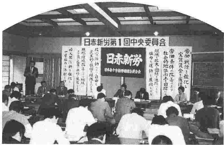
昭和60年第1回中央委員会 (5月12~13日)