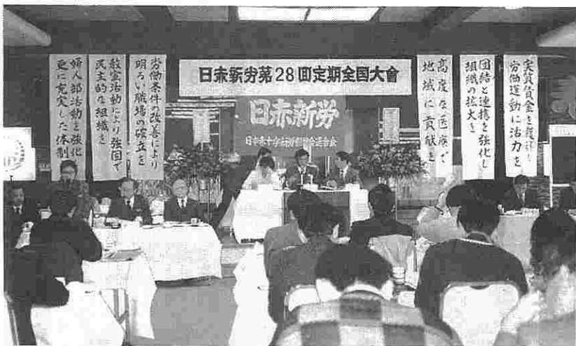
活発な討議のおこなわれた第28回定期全国大会