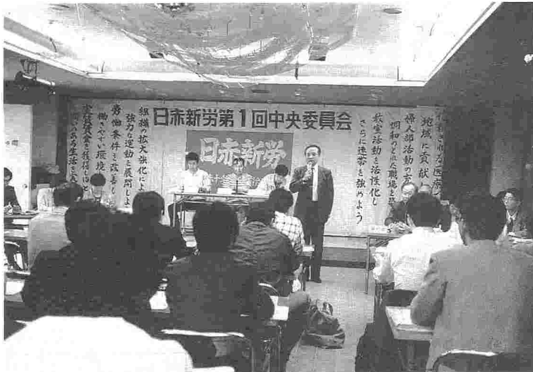
活発な意見が交された平成2年度第1回中央委員会

未組織施設及び未加入組織へのアプローチを積極的に行ない、組織の拡大・拡充を図ってゆく。