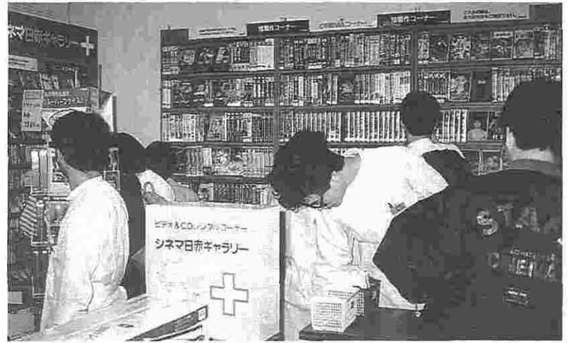
好評のレンタルコーナー

全国に三十店舗もある大手のレイトAV事業部との協力を得て、病院の近くにある名古屋店と大形のシネマ屋ケ店との両方に利用できるとの申し出(別掲)を発行しました。病院内にビデオショップ? 当初より大きな反響もあり、市内のどの店よりも安くレンタルできることが大きなメリットと思われる。 今世間一般的には娯楽を何に求めるのか世論調査の中で最も