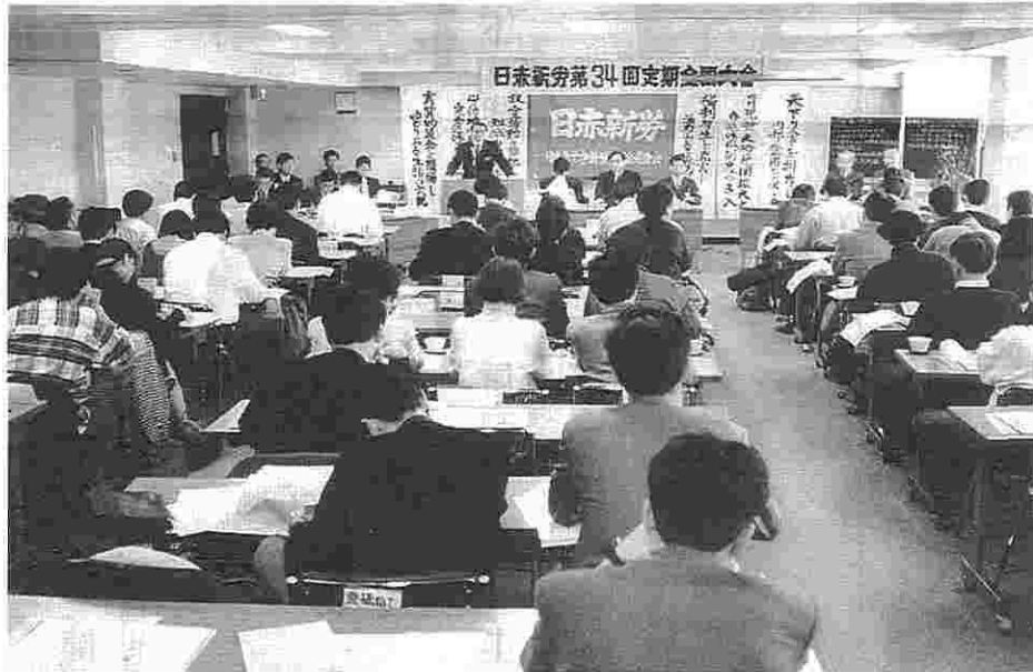
第34回定期全国大会 (2月26日~28日、浜名荘にて)