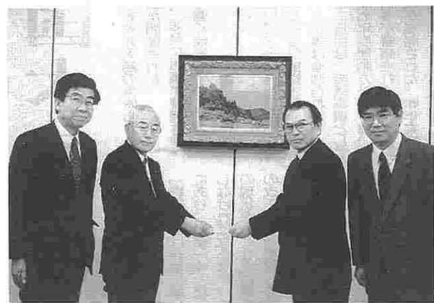
義援金を日赤本社へ寄付 (左から、小形組織推進部長、上沢人事部長、梅村執行委員長、坂本副執行委員長)

この地震によって家を失い、暖房も水もない不便な避難生活を余儀なくされている被災者の方々に、一日も早く安心した日常生活が送れるように、全国で善意の義援金を兵庫県、大阪府、神戸市、日本赤十字社兵庫県支