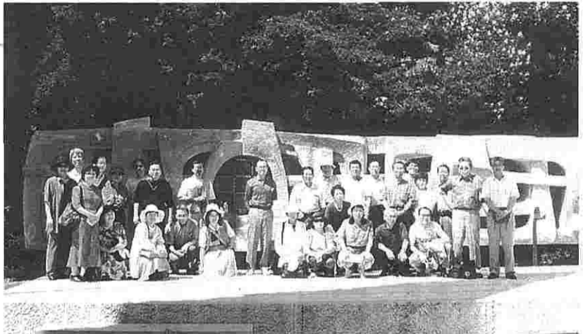
ソルフェリーノの丘に立つ赤十字記念碑の前で

今回訪問したドイツ赤十字教会所属ナースホームは、居住棟と介護棟に分かれていました。介護棟入居者には、96年7月より導入された介護保険が適用され、介護保険の認定された利用者については、入居費の一部(3段階に区分)が介護保険より給付されています。一方、介護を要しない居住棟入居者はすべて自己負担となっているので、年金などでの支払不足分については社会扶助が行われています。入居にかかわる費用は、施設によって自由に決めることができますが、公的機関の認定を受けなければなりません。ホームを改造した場合などは個人の負担増となり、ホームごとにその費用は異なるようです。