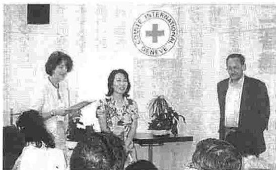
国際赤十字委員会で活動状況の説明を聞く

今回訪れたのは、イタリア北部の田舎町カステリオーネにある赤十字国際博物館(当時使用された担架や手術器械等が展示)と、ソルフェリーノの丘(赤十字記念碑)や納骨堂(戦死者の遺骨一頭蓋骨や肢体が整然と納められている)、救助の拠点となったキエザ・マジョレ教会などです。