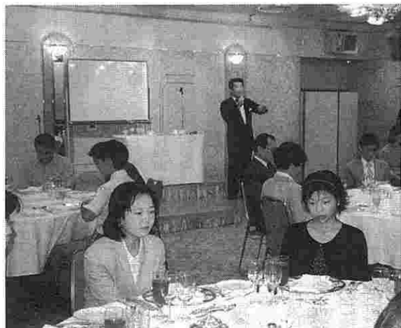
ホテル講師の指導のもとでテーブルマナーを学ぶ

会場は集合に便利な「ホテルアソシア名古屋ターミナル」で、研修会と併せ、テーブルマナーのアトラクショ