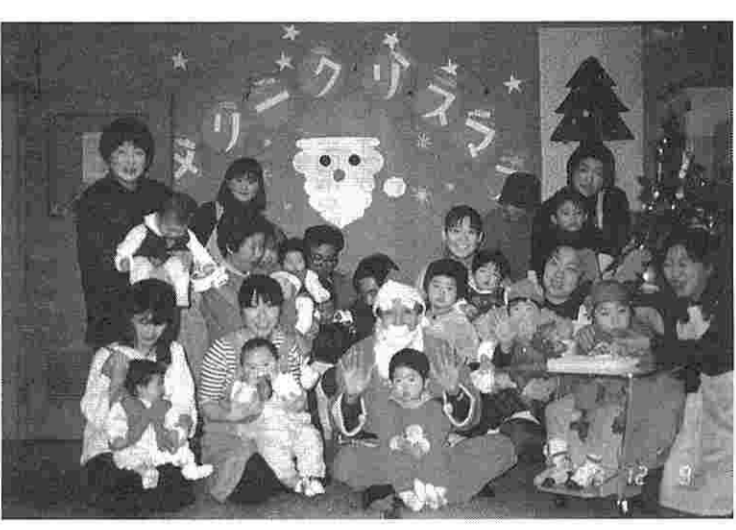
子供たちといっしょにメリー・クリスマス♪